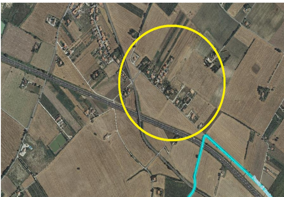
Figura 2: Zona San Martino