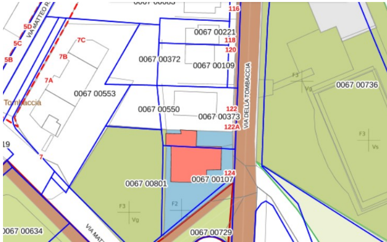
Figura 1: In rosa la chiesetta