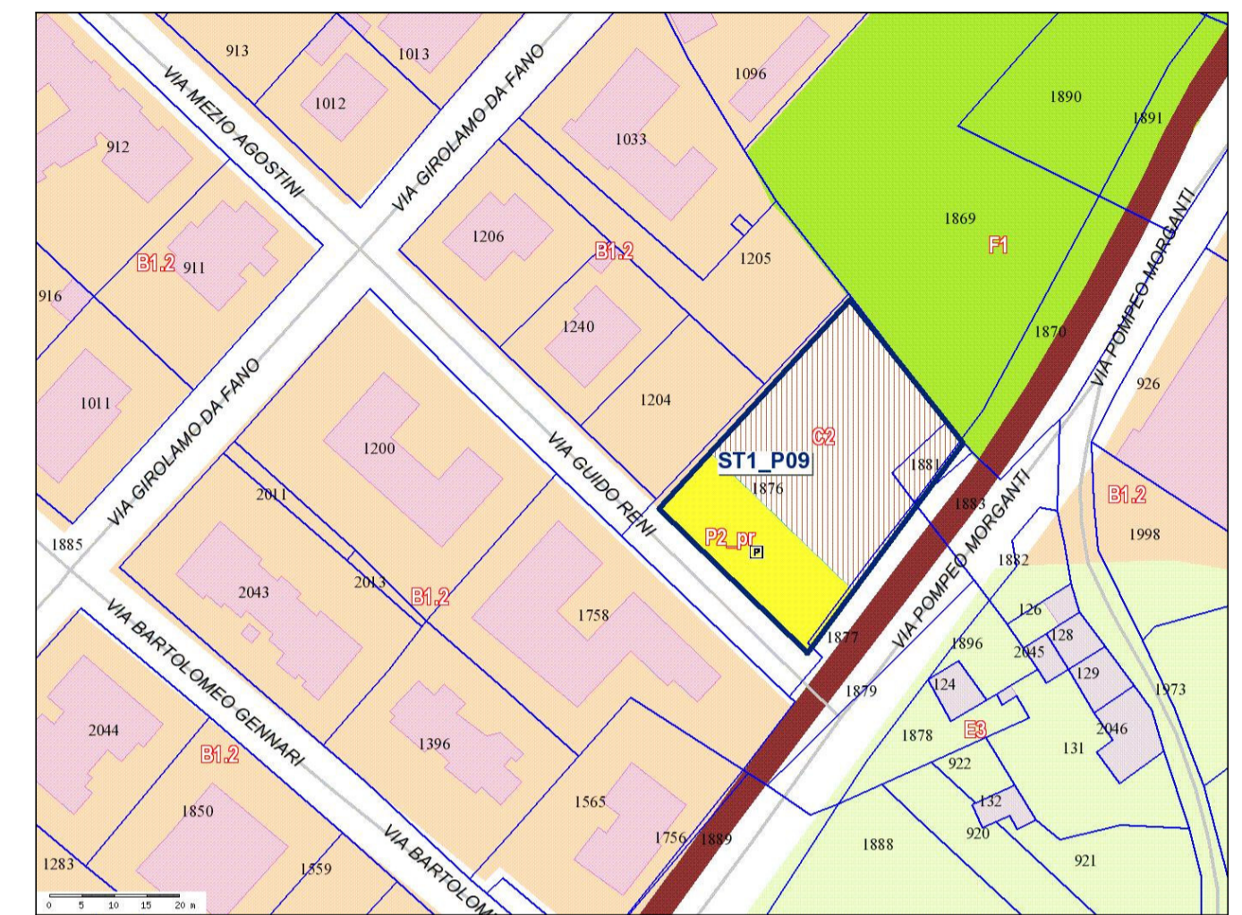
Stralcio PRG scala 1:1000