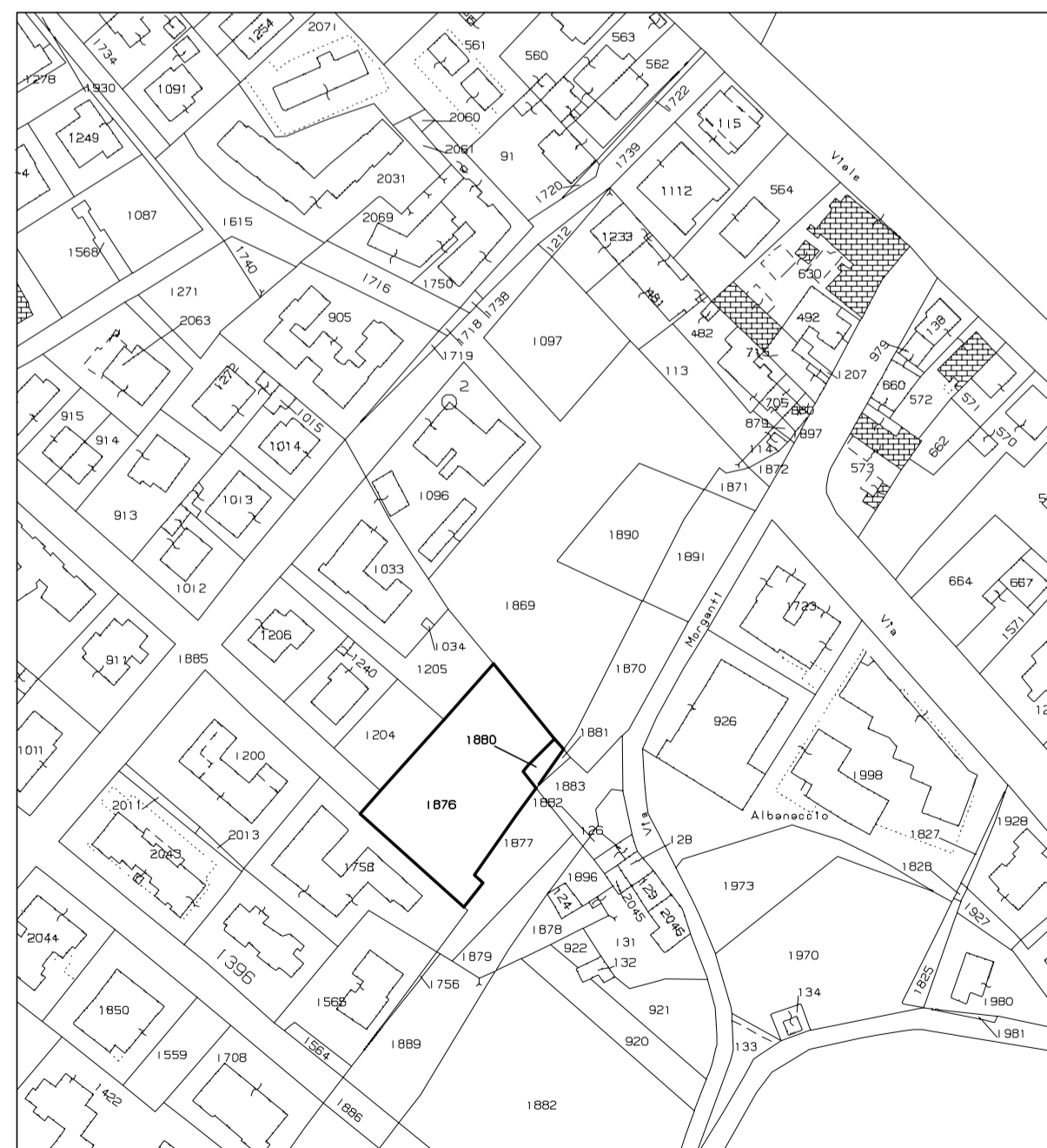
Stralcio mappa catastale scala 1:2000