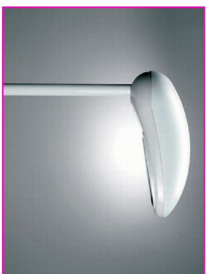
P2: Puntolo luce 150W SAP H=8m fuori terra P3: Puntolo luce 100W SAP H=8m fuori terra