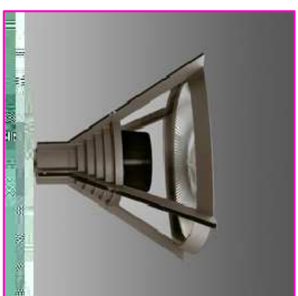
P1: Puntolo luce 150W JMT H=2,1m fuori terra