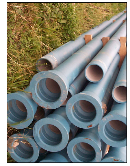
TUBO IN GHISA DN 60 - 100