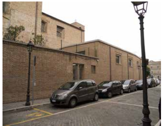
UNITA' EDILIZIA 28