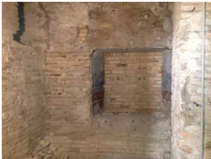
Collegamento tamponato tra convento e Chiesa