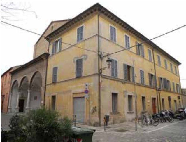
UNITA' EDILIZIA 27

Committente: Provincia Picena di San Giacomo della Marca dei Frati Minori