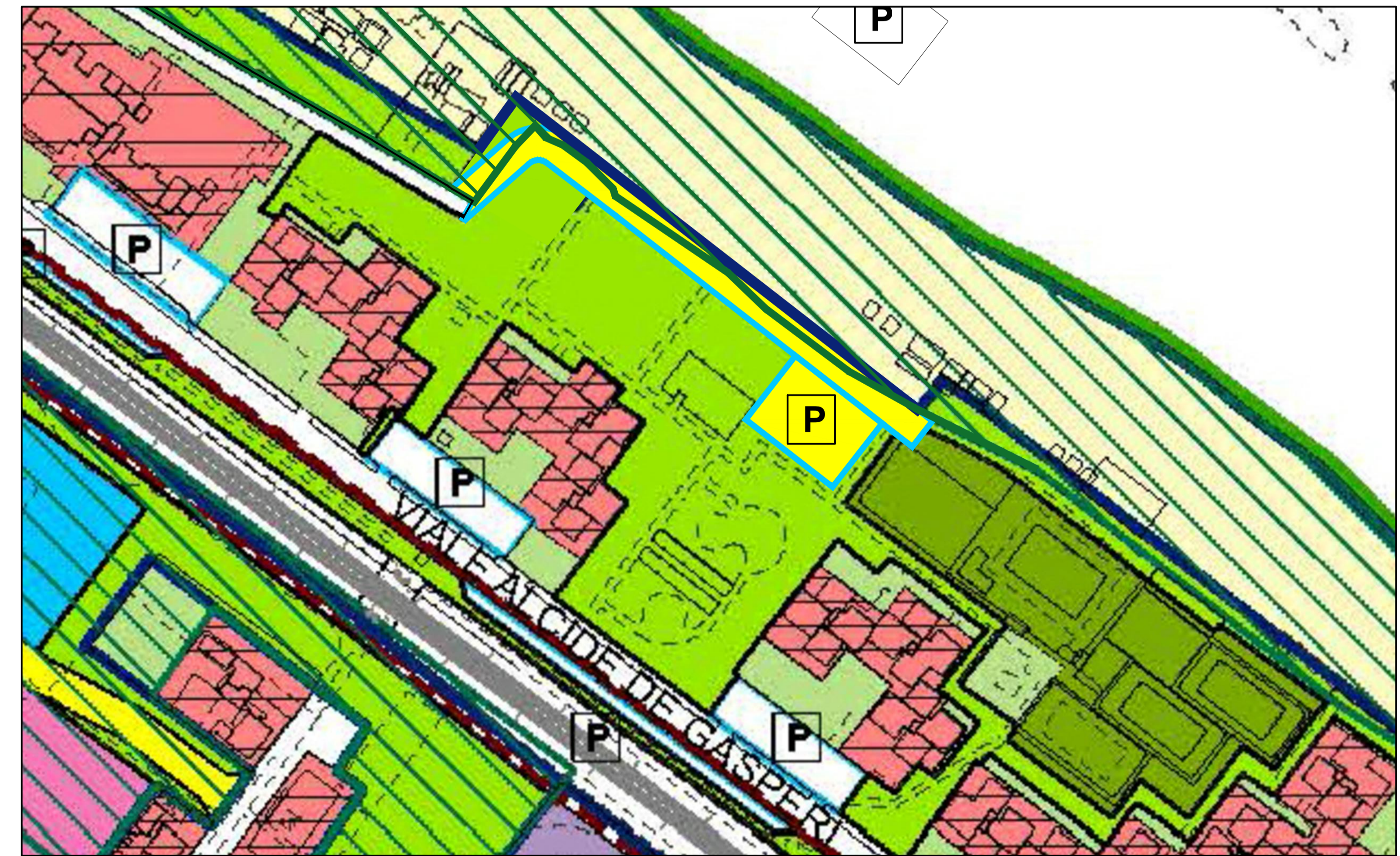
ESTRATTO DI P.R.G. CON AMBITI DI TUTELA