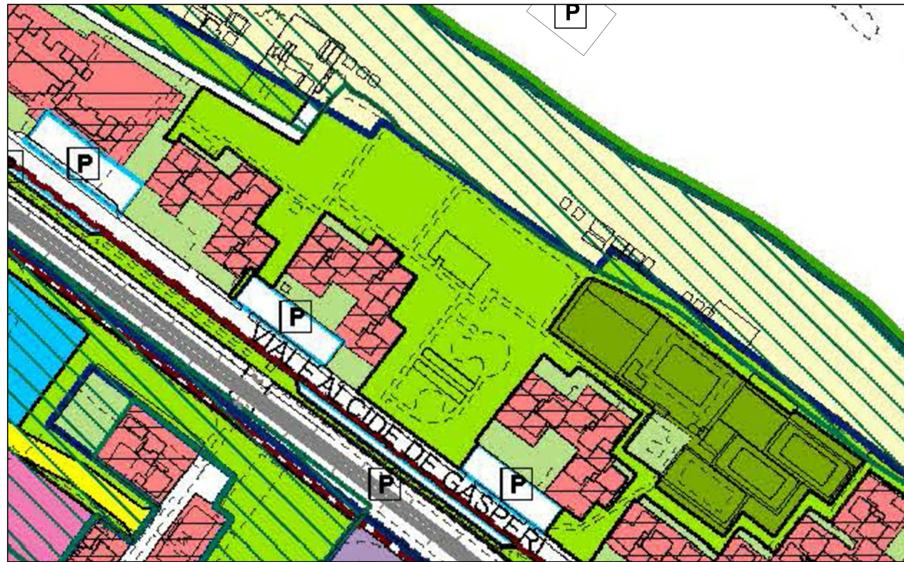
ESTRATTO DI P.R.G. CON AMBITI DI TUTELA