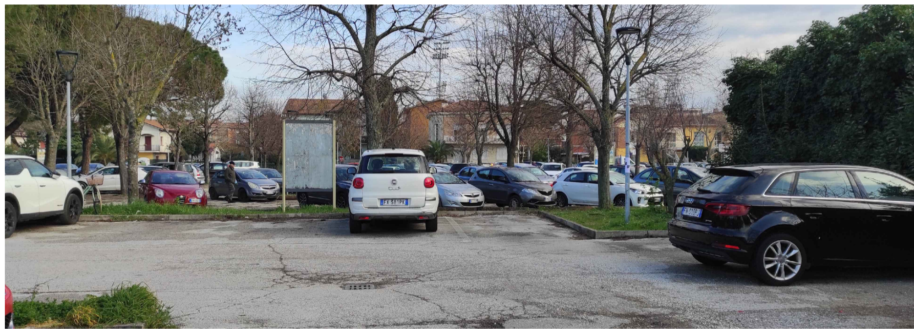
1- FOTO DI RILIEVO "MACRO AREA 1"