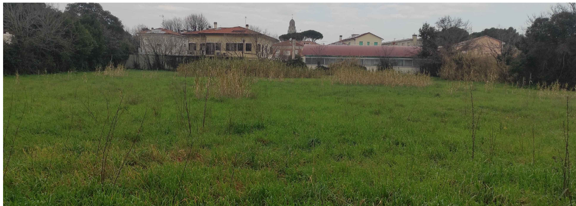
2- FOTO DI RILIEVO "MACRO AREA 2"