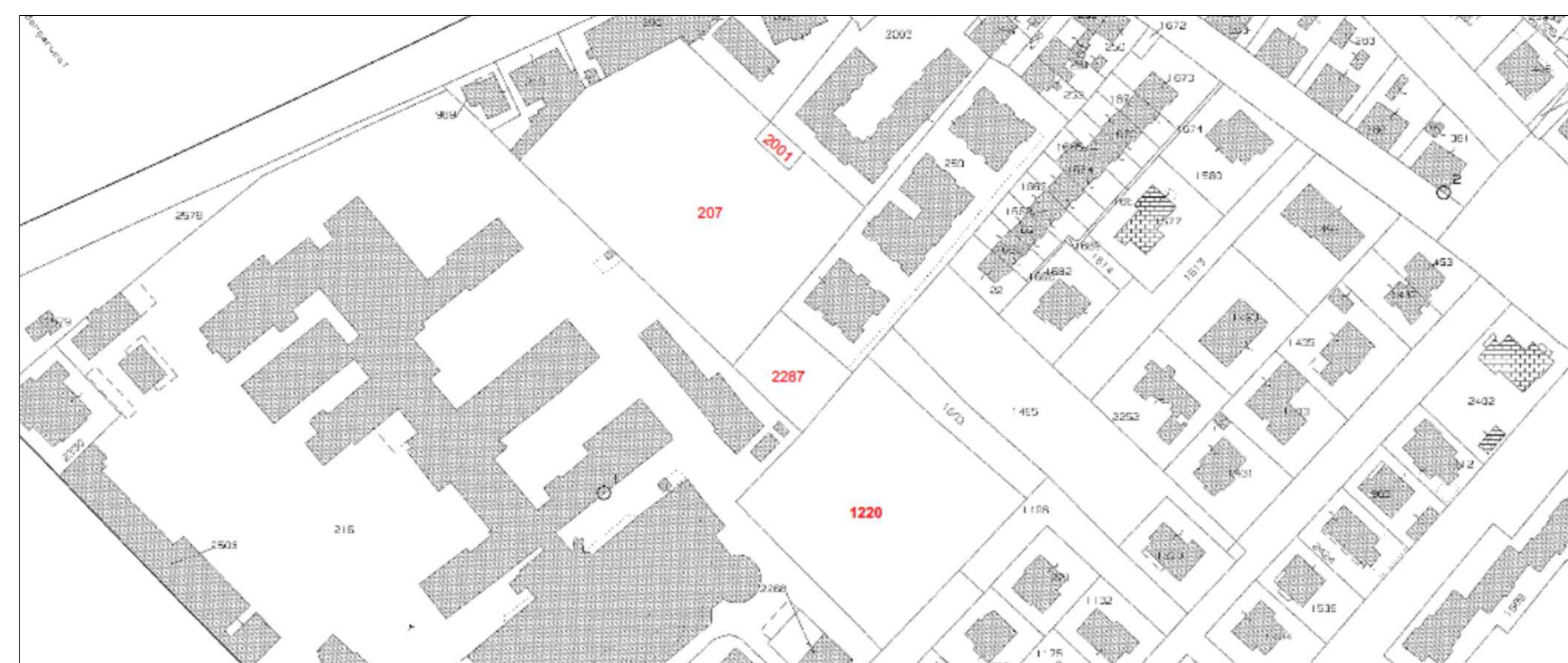
STRALCIO MAPPA CATASTALE FOGLIO 38 COMUNE DI FANO